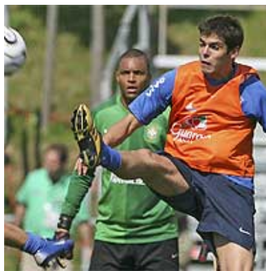
Kaká despeja el balón en un entrenamiento. ampliar

Serio, educado y muy despierto, Kaká parece poco inclinado a irse de farra como hicieron hace unos días la mayoría de las estrellas brasileñas con el permiso del entrenador, Carlos Alberto Parreira. Kaká, de 24 años, vive cerca de la iglesia de Santa Maria delle Grazie, en Milán, donde está el Cenáculo de Leonardo. Le gusta el arte y frecuenta más la vida cultural milanesa que sus tiendas de ropa prêt à porter . En el campo, eso sí, es pura fiesta en ese cuadrado mágico que forman Ronaldo-Adriano, Ronaldinho-Kaká.